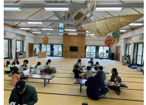
ホールを昼食用に借りました

お昼休みを前倒して X カントリースキー組 は外へ。スキーを装着していざ練習！汗をたっぷりかく激しい運動？たくさん転んで、たくさん笑って・・・