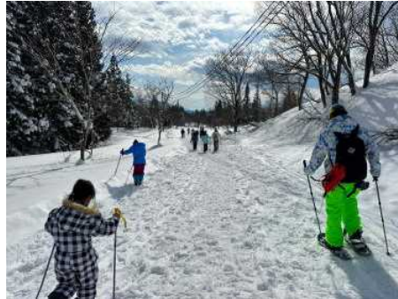
疲れた体 でもあと一歩