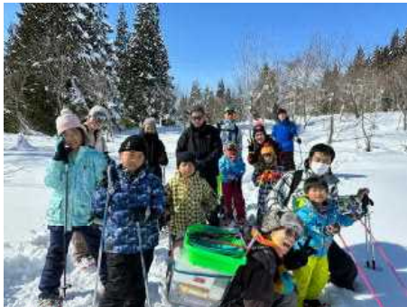
それぞれスノーシューをはいて