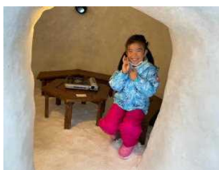
夕暮れ時のかまくらの中