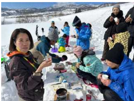
雪のテーブルを作ってチョコホンデユ

ブナには風の通り道が記され、雪が片側にだけ付く現象を見ました。大分歩き疲れた人たちもいましたが、頑張って棚田まで行き着きました。