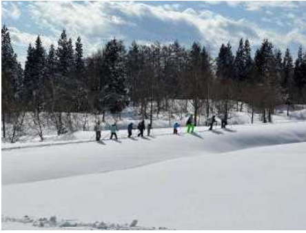
みんなで並んで帰ります