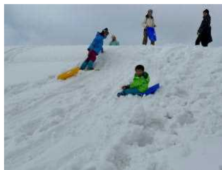
棚田（たなだ）に到着