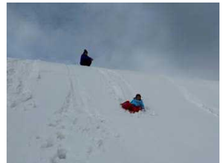
みんなで思い切りそり遊び

ブナには風の通り道が記され、雪が片側にだけ付く現象を見ました。大分歩き疲れた人たちもいましたが、頑張って棚田まで行き着きました。