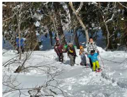
雪の中の森、雪の原を歩きました。