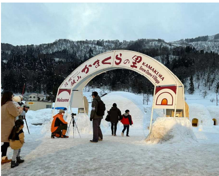
帰り道にはかまくらの里へ

休憩をたっぷり取った雪遊び組は雪遊びに。雪をよけた山からもう一度滑り降りて大はしゃぎ！！ 大胆な雪遊びを展開していました。