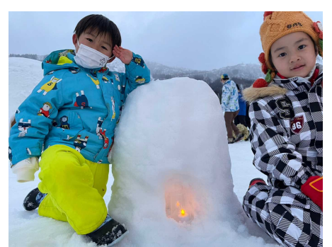
かわいいエントランス用のあかり