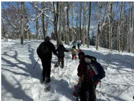
ブナの森も通り抜け