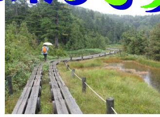
四十八池は木道を 白根山 お釜→