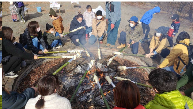
井戸端会議のようになごやか