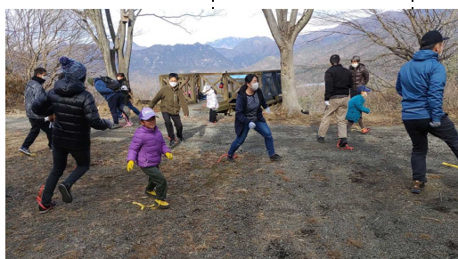
準備運動の紙テープ踏み