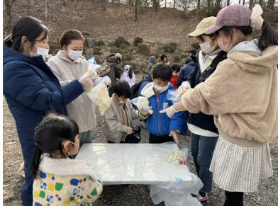
材料をもらっていよいよ棒パン作り