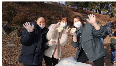
園の先生たちも体験と活動協力!