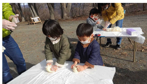
こねこねよく練って