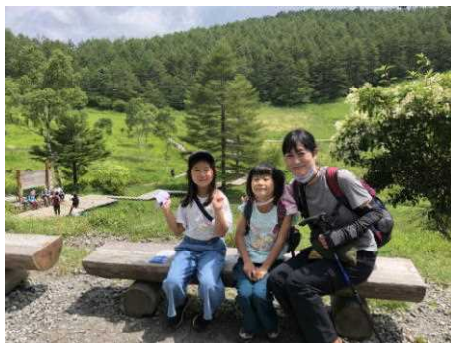
ちょっぴり休憩です！