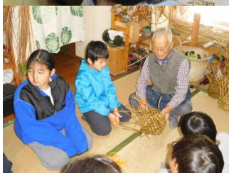
みんな頑張りました