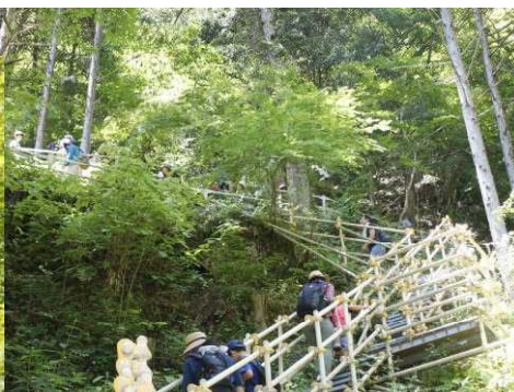
山道にも階段が・・・