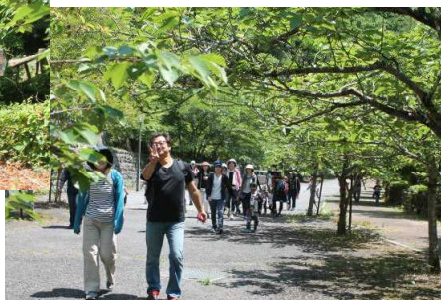
足取りも軽く出発！