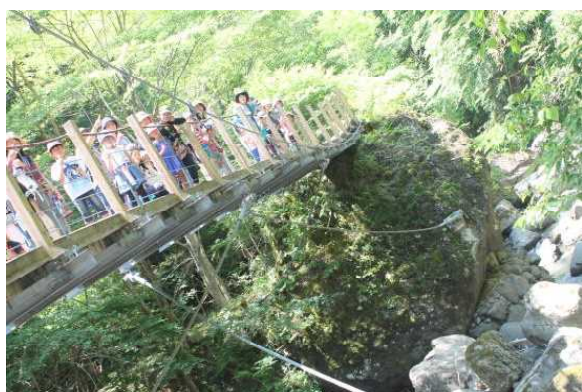
まずは1つめの吊り橋へ