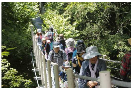
3つめは行き止まりの吊り橋