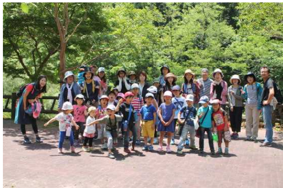
大柳川溪谷 出発点公園に到着