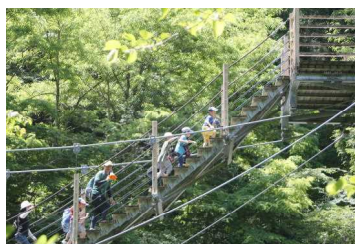
2つめは少し変わった踊り場のあるつり橋